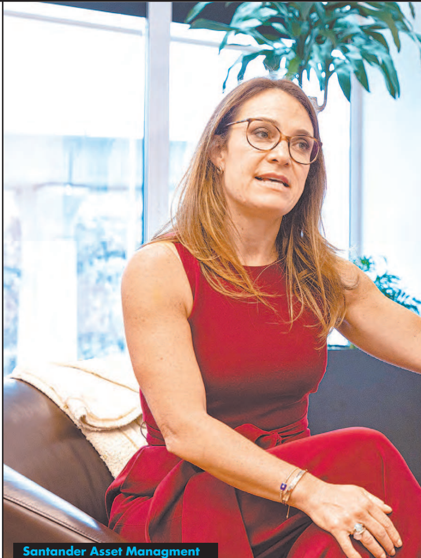
Santander Asset Management

Agregó a pesar de que en los últimos años las fin-tech han resultado una alternativa ofreciendo servicios más digitales también es una buena oportunidad para la banca tradicional para seguir creciendo y